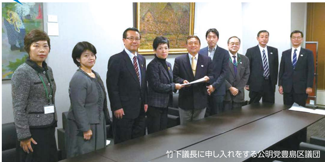
竹下議長に申し入れをする公明党豊島区議団